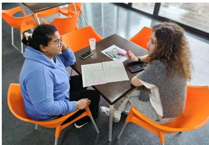
La participant belga treballant en un poema durant un taller.

El grup va ser realment increïble: obert de ment, curiós i amb ganes d'aprendre els uns dels altres. Això va crear un espai segur per parlar de les nostres experiències, reptes, salut mental i identitat. Va ser genial conèixer-nos millor i descobrir les cultures de cadascú. Vam aconseguir crear un grup proper, acollidor i de suport, fet que va fer que tota l'experiència fos inoblidable.