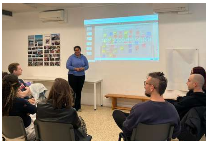
La Mithila presentant la seva entitat a la resta de participants.